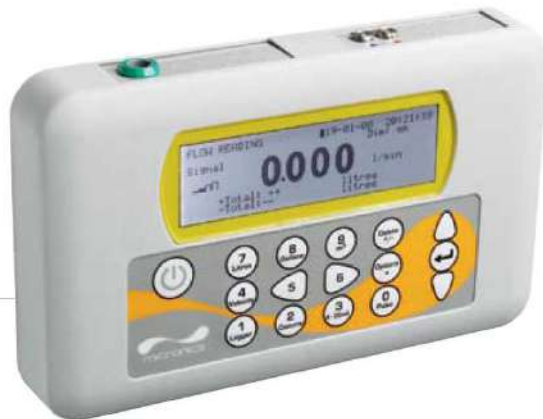
PF220 - Flujometro ultrasónico portátil